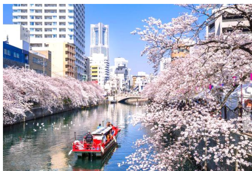
大岡川の桜（黄金町～日ノ出町付近）