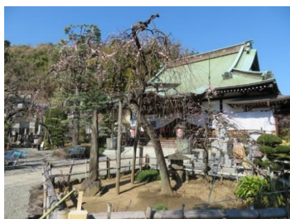
妙法寺の照水梅と本堂

* 無線ガイドシステムを使用します。ご自分のイヤホン（φ3.5mm）を必ず持参してください。