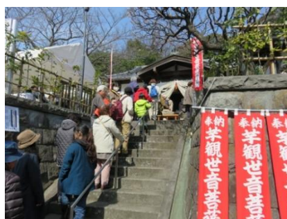
長昌寺芋観世音前の行列