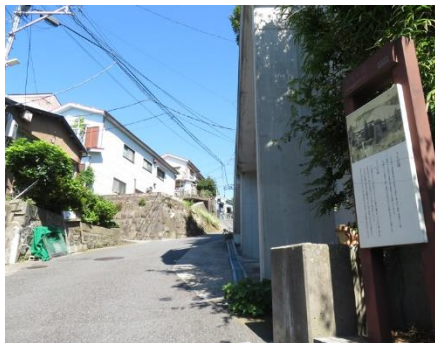
うぐいす坂とその案内板

*無線ガイドシステムを使用します。ご自分のイヤホン(φ3.5 mm)を必ず持参してください。