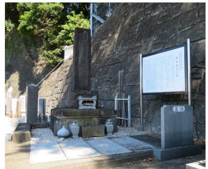
信楽寺・お龍の墓