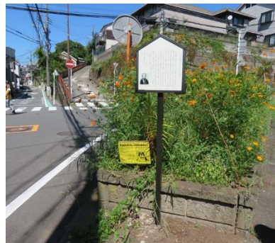
お龍が住んだ深田台