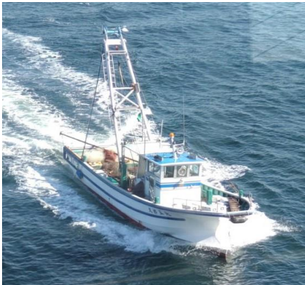
小柴沖から戻る漁船