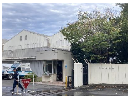
第一機動隊(旧飛行艇格納庫)