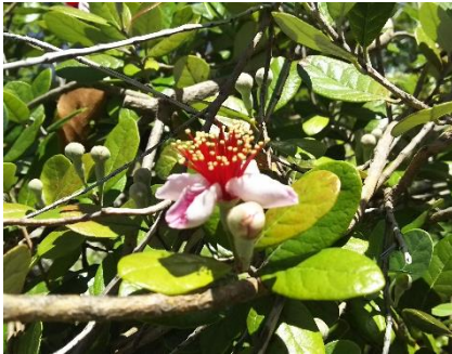
フェイジョア（平潟湾プロムナード）

* 無線ガイドシステムを使用します。ご自分のイヤホン（φ 3.5 mm）を必ず持参してください。