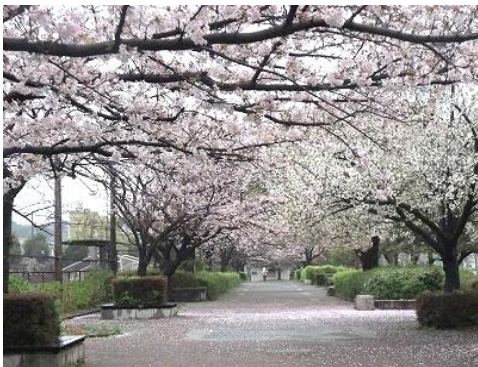
長浜公園の桜並木

* 無線ガイドシステムを使用します。ご自分のイヤホン（Ø 3.5 mm）を必ず持参してください。