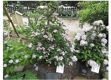
瀬戸神社のヤマアジサイ