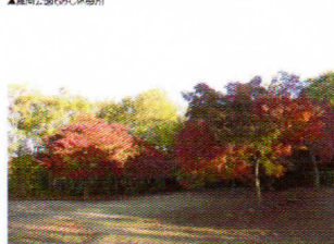
小屋戸の里 もみじ休憩所 2016年11月の紅葉 舞岡公園 HP より