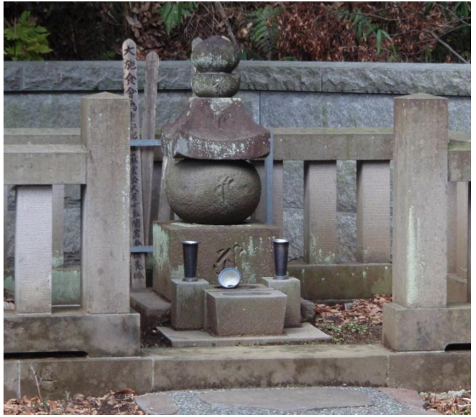
白山六郎重保公廟所