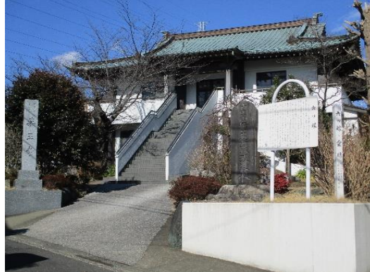
六ツ塚と畠山重忠の霊堂(薬王寺)