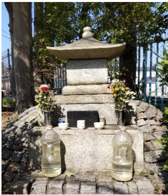
内室菊の前の駕籠塚

鶴ヶ峰駅北口→鎧の渡し緑道→首塚→重忠公碑・さかさ矢竹→矢畑・越し巻き→すずり石水跡→薬王寺・六ツ塚→鶴ヶ峰神社→駕籠塚→白根地区センター→白根不動・白糸の滝→白根アパートバス停→鶴ヶ峰駅北口(解散) * 諸般の事情により、コースの一部が変更になる場合があります。 * 荒天(交通機関に影響がある場合)中止です。 * 歩き易い服装・靴で参加してください。 * 無線ガイドシステムを使用します。ご自分のイヤホン(φ3.5mm)を持参してください