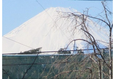
遊行寺境内から富士山を望む