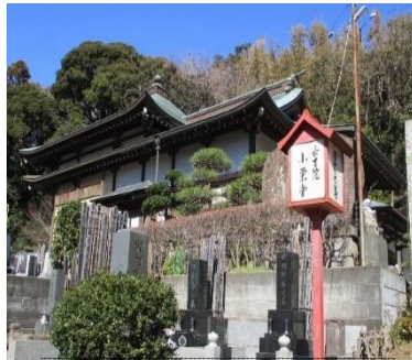
遊行寺境内長生院・小栗堂