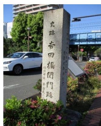
吉田橋関門跡の碑