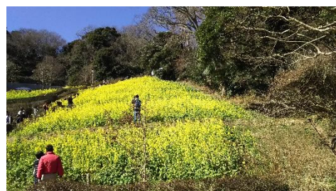
金沢動物園・植物区：菜の花

集合場所：京急本線 金沢文庫駅西口広場（改札口で協会員が待機し、受付場所へ案内します） ＜当日『横浜金沢魅力帳』（500円）の販売があります＞