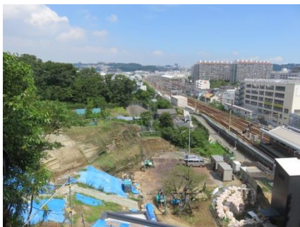
権現山眺望(円通寺・東照宮跡)