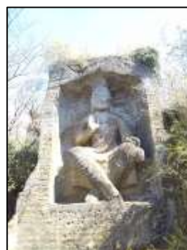
←Maitreya-bodhisattva carved in a cliff