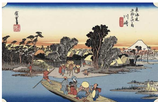
川崎六郷渡舟（歌川広重）