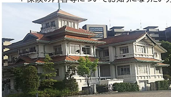
旧東伏見宮別邸(貴賓館)