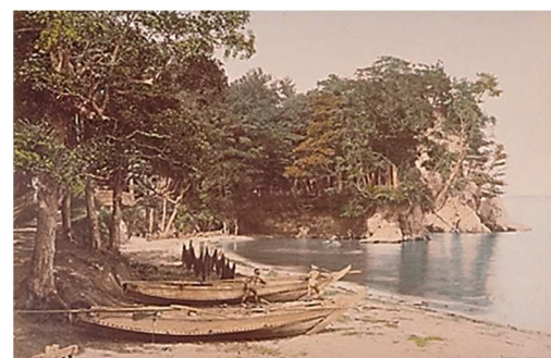
富岡八幡宮の浦