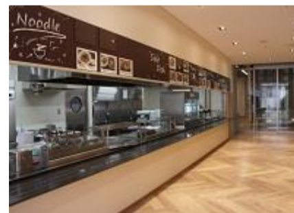
3号館食堂 ローズ (3号館1F)