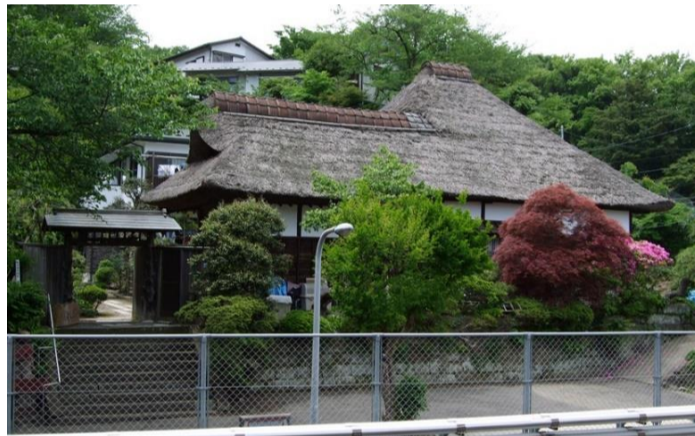
旧円通寺客殿(旧木村家住宅主屋)