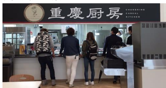
3号館食堂 重慶厨房 (3号館1F)